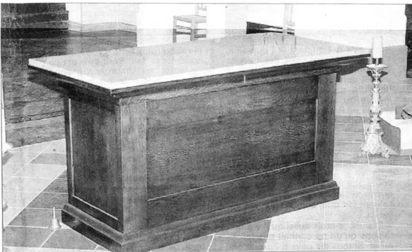
Un magnifique autel, œuvre de notre ébéniste d'art.